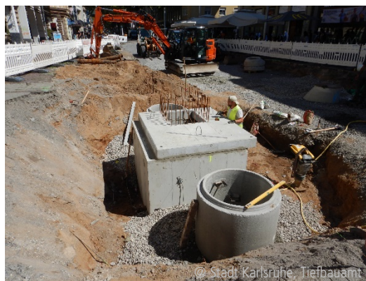
Abbildung 3: Baugrube für die neue Technikkammer/Technikkammer mit Schächten zur Be- und Endlüftung