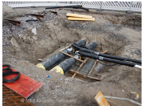
Abbildung 2: Querung Fernwärmeleitung im Baufeld 4

Zukünftig soll im Bereich der alten Gleise ein rund 6 Meter breites Zierband aus kleinformatigem Pflaster, analog zum Marktplatz, entstehen. Da dieser Bereich aber zur Andienung der folgenden Baufelder sowie der umliegenden Maßnahmen dient, wird die Verlegung des Pflasters an den Schluss der Arbeiten gestellt. Andernfalls müssten durch die starke Befahrung in Kombination mit der fehlenden Einbindung der Fläche unnötige Beschädigungen und Verschmutzungen des Pflasters befürchtet werden. Die Verlegung des Zierbandes hat durch das kleinere Format den Vorteil, dass die Verlegung relativ kleinräumig ohne große Sperrungen und losgelöst von den übrigen Arbeitsschritten erfolgen kann.