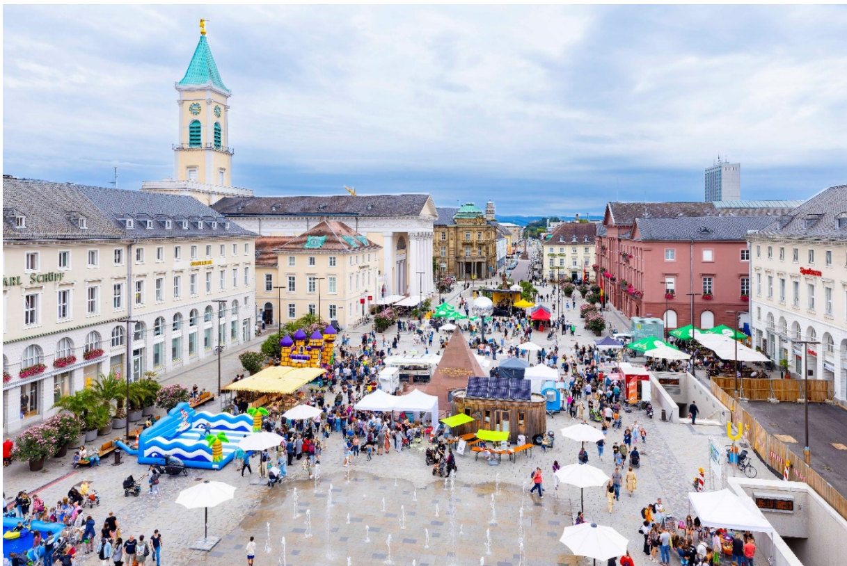
Abbildung 4: Überblick Kindertag 26. August 2023

Es finden viele Aktionen rund um die Baustelle statt. Aktuellstes Beispiel hierfür war der Kindertag am 26. August 2023. Hier fand eine Vielzahl von Aktionen auch mit Bezug zur Baustelle statt. So konnten Kinder oder andere Interessierte ihr Talent zum Beispiel in einem Gabelstapler-Parcour beweisen.